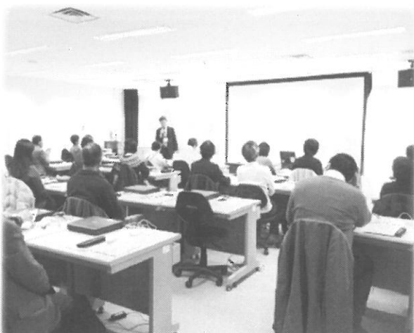
《ITサポーターの研修》

大阪府ITステーションは、障がいのある方の学ぶこと、つながること、働くことへのチャレンジを応援します！