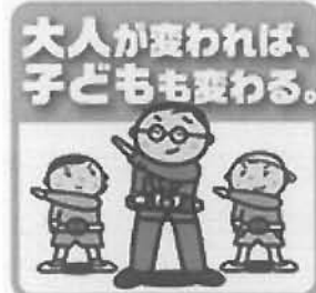
大阪府・青少年育成大阪府民会議

この度、内閣府により「平成29年度『子供・若者育成支援強調月間』実施要綱～支えよう輝くひとの夢みらい～」が策定されました。青少年育成大阪府民会議でも、11月を強調月間として「大人が変われば、子どもも変わる。」運動を取組むこととしております。